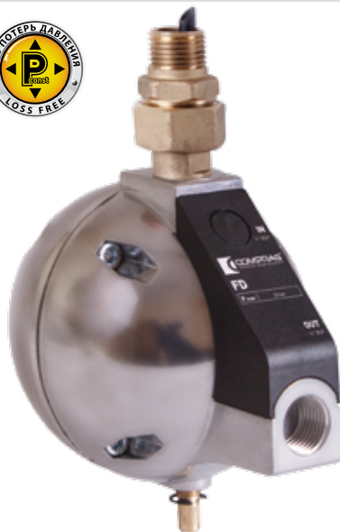
На фотографии FD